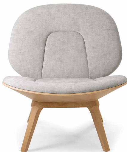
Fauteuil in Eiche EI200 Sand, Maple chalk