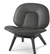
Fauteuil Fauteuil Armchair

– Base frame in solid wood, seat and backrest shell made from moulded plywood stained in line with our list of wood colours in EI200 Sand or EI204 Mokka – Origin of wood: Croatia