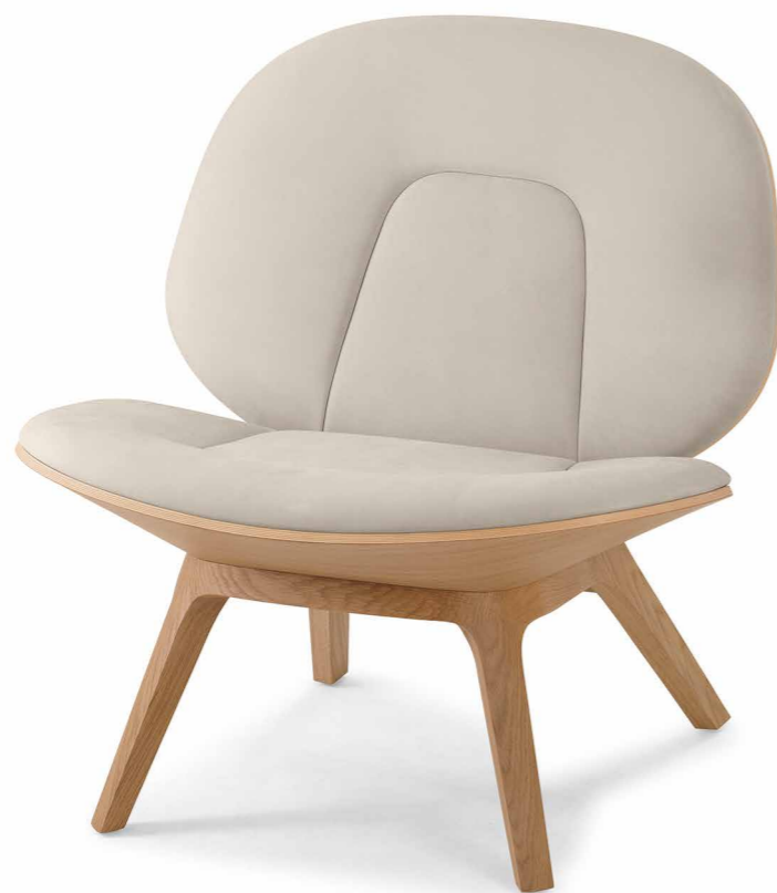
Fauteuil in Eiche EI200 Sand, Velluto ivory