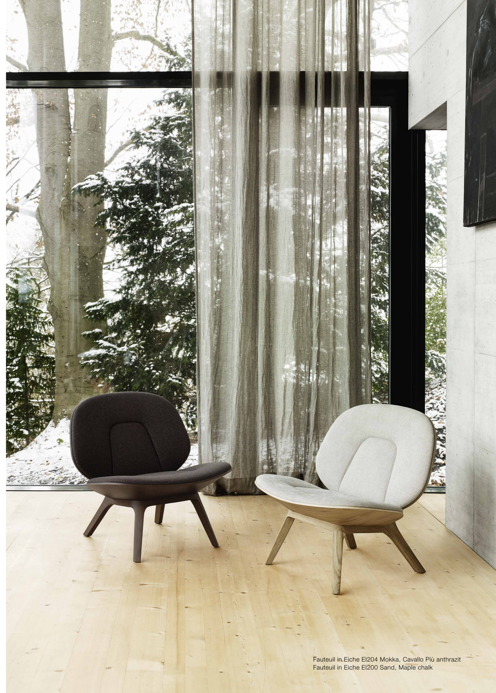
Fauteuil in Eiche EI204 Mokka, Cavallo Più anthrazit Fauteuil in Eiche EI200 Sand, Maple chalk