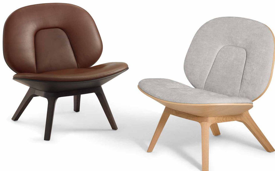
Fauteuil in Eiche EI204 Mokka, Anilina hasel Fauteuil in Eiche EI200 Sand, Maple chalk